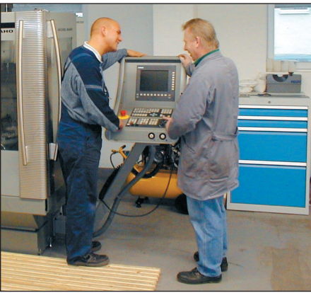
Gefragte Fachkräfte – CNC-Maschinenbediener.

Termine der Informationsveranstaltungen: Montag, 3. 11. 2008 und Montag 10. 11. 2008, 10 Uhr, Jobstart, 1. Stock Raum Kiel Sophienblatt 74-78, 24114 Kiel Dauer: ca. 2 Stunden