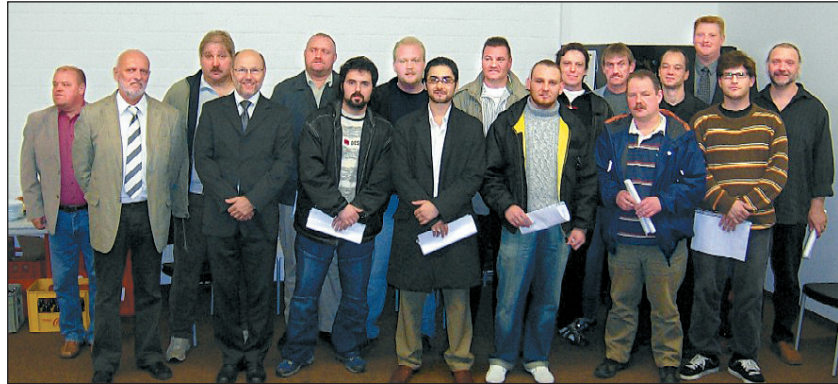
Sie haben es geschafft und eine neue Arbeit als Gießereifachkraft.

Besonders erfreulich für die Gießerei und anderen Gießereien zertifizierten Gießereifachkräfte erhielten. Der Weg von Hartz IV ist, dass alle eine sofortige Einstellung zurück ins Berufsleben ist gelungen durch Time Partner bei der glücklich.