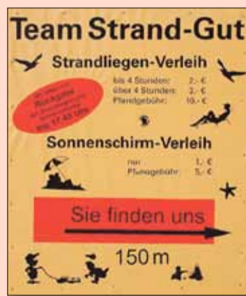
Schilder weisen den Weg zu „Strandgut“.

und bieten südländischen Komfort an der Kieler Küste. Das exklusive Strandgefühl gibt es seit fünf Jahren von Juni bis Ende September. In der Saison werden die Schirme und Liegen täglich von 10 bis 18 Uhr von Mitarbeitern des Projektes „Strandgut“ vermietet.