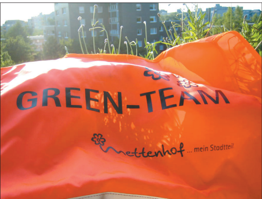
Das Green-Team macht Mettenhof grüner und bunter.

Als im Juni 2005 rund 50 Helfer aus Mettenhof, darunter auch Ein-Euro-Jobber, eine rd. 300 m 2 Eingangsrabatte am Skandinavien-damm gestalten, ahnt noch niemand, was sich daraus entwickeln würde. Mit Unterstützung des Stadtteilbüros und des Grünflächenamtes sowie finanzieller Hilfe von Sponsoren aus dem Stadtteil werden im Bereich zwischen Russeer Weg und Göteborgring im Rahmen der Entente Florale rd. 2000 Blütenstauden gepflanzt. Aber wer soll diese Flächen zukünftig pflegen?